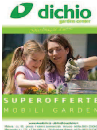
DICHIO VIVAI GARDEN